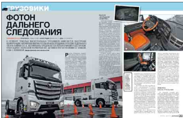
FOTON AUMAN EST-A