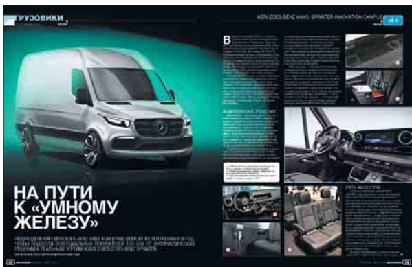
MERCEDES-BENZ VANS: SPRINTER INNOVATION CAMPUS