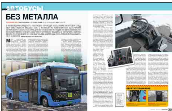
EVOPRO MODULO C68E